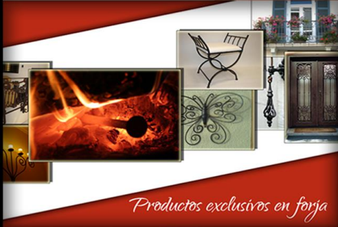
Productos exclusivos en forja